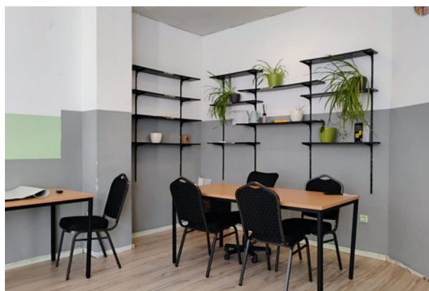
Einer unserer Standorte: Zschochersche Str. 50

Das KolLEktiv - Treffpunkt für Engagement und Begegnung ist ein Raum in Leipzig für migrantische Organisationen, Vereine und Initiativen (MO). Ziel ist es, Büro- und Arbeitsräume zur kostenlosen Nutzung bereitzustellen, Begegnung zu ermöglichen und die Tätigkeiten migrantischer Organisationen sichtbarer zu machen. Zusätzlich unterstützt das KolLEktiv bei Bedarf mit Coachings. Regelmäßige Treffen für die im KolLEktiv organisierten MO dienen zur Vernetzung untereinander, sowie zur Mitgestaltung der Projektweiterentwicklung.